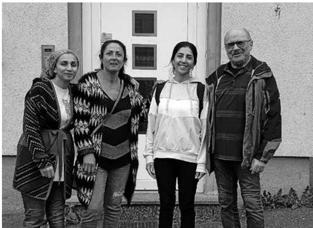
Erste Kontakte des AKF mit den jungen Müttern der neuen türkischen Familien

geben werden können. Oft ist auch gleich ein erster Arzt- oder Behördenbesuch nötig. In letzter Zeit werden unseren Flüchtlingsunterkünften in Plüderhausen aber immer wieder und zunehmend Menschen zugeteilt, die Türkisch als ihre Muttersprache oder als einzige Fremdsprache haben. Deshalb sind wir sehr froh, dass uns Serap Schlotz, soweit es ihr zeitlich möglich ist, tatkräftig unterstützt. Nicht immer lassen ihre Arbeitszeiten das jedoch zu. Deshalb suchen wir dringend nach weiteren Mitarbeitern, die uns beim Deutsch-Türkisch-Übersetzen helfen können. Plüderhäuser mit türkischem Migrationshintergrund sind uns genauso willkommen für diese Aufgabe wie deutsche Mitbürger, die Türkisch gelernt haben. Oder haben Sie als Leser der Gemeindemitteilungen vielleicht einen türkischsprachigen Nachbarn oder Freund, den sie mal auf diese Aufgabe ansprechen könnten?