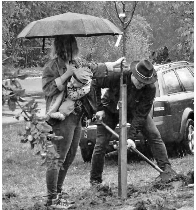
Ein Baum für die nächste Generation ist gepflanzt