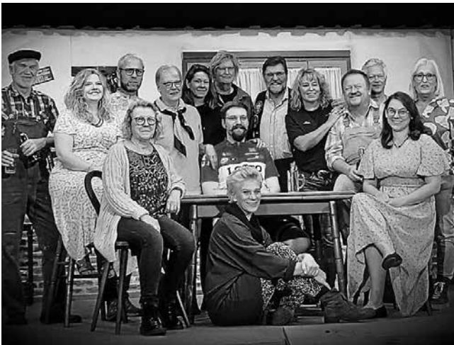
Die Darstellenden samt Maske und Technik