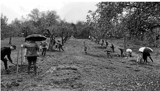
Geschäftiges Arbeiten in feuchter Witterung

Das Team vom Gemeindebauhof hatte Pflanzlöcher vorbereitet, die Bäume besorgt und hielt das nötige Werkzeug und Befestigungsmaterial bereit.