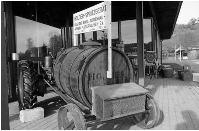
Die Holder Selbstfahrerspritze des OGV Plüderhausen aus dem Jahre 1938.