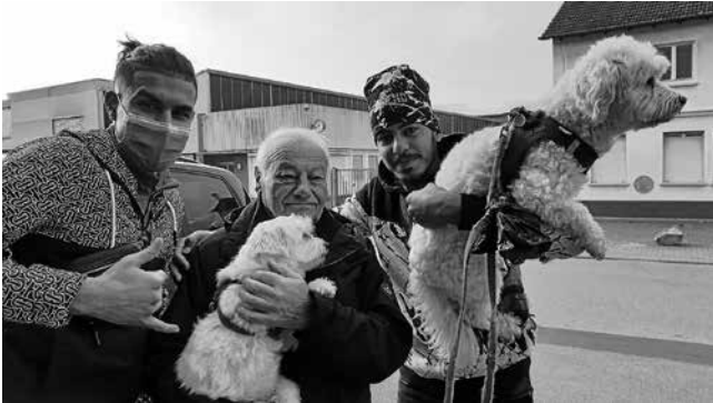
Die jungen Männer aus Syrien haben den freundlichen Nachbarn mit seinen Hunden bei ihrer Ankunft gleich ins Herz geschlossen

Wikipedia definiert „Willkommenskultur“ als „eine positive Einstellung von Bürgern, Politikern, Unternehmen, Bildungseinrichtungen, Sportvereinen und anderen Institutionen zu Migranten“. Gleichzeitig werde in diesem Begriff auch der Wunsch ausgedrückt, dass Migranten allen Menschen, denen sie begegnen, willkommen sein mögen. Dass in Plüderhausen eine solche Willkommenskultur besteht, spüren manche Flüchtlinge oft schon bei ihrer Ankunft in unserem Ort.