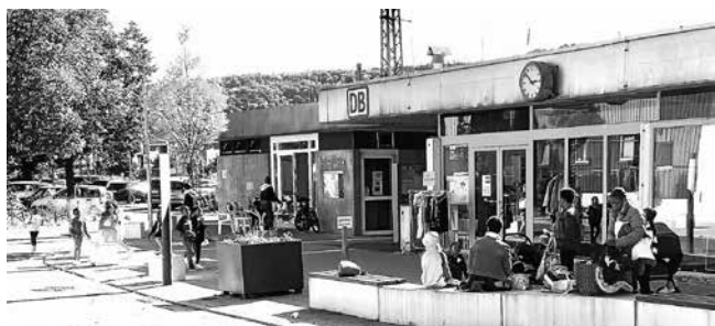
Viele Besucher am letzten Freitag