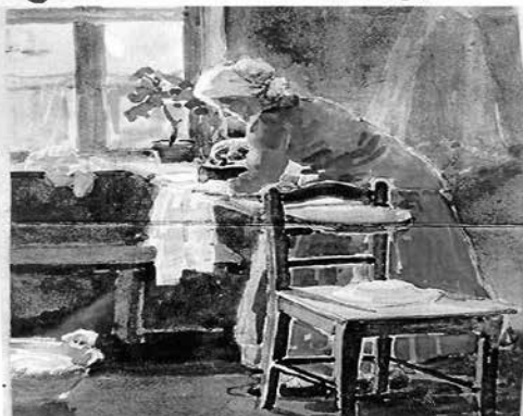
NEU die „Bügelstube am Bahnhof“