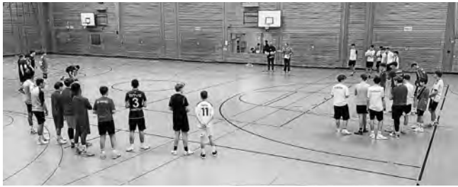
Fünf Mannschaften traten zum Turnier an

Auf der Tribüne fieberten Eltern, Großeltern und Freunde mit. Organisiert wurde das Turnier von den Jugendhäusern Plüderhausen und Urbach. Die Spielleitung lag auch diesmal wieder bei Herrn Fetzer.