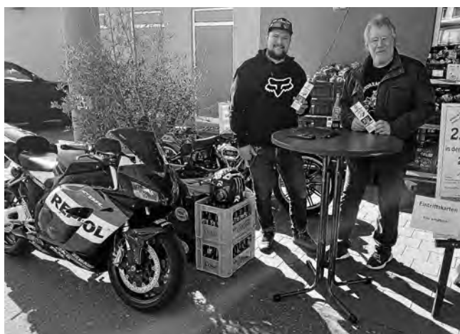
Das Bild zeigt unseren Vorverkaufsstand im letzten Jahr

Für alle, die den Sondervorverkauf zeitlich nicht wahrnehmen können, sind Tickets weiterhin im Vorverkauf bei Donner Buchladen, im Bürgerbüro Plüderhausen sowie online unter www.mf-p.de erhältlich.