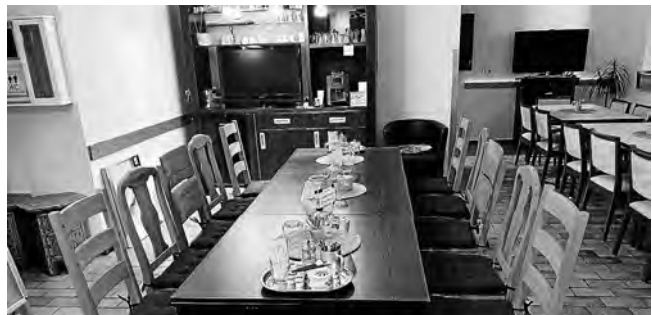
WILLKOMMEN im „Treffpunkt HOFFNUNG“