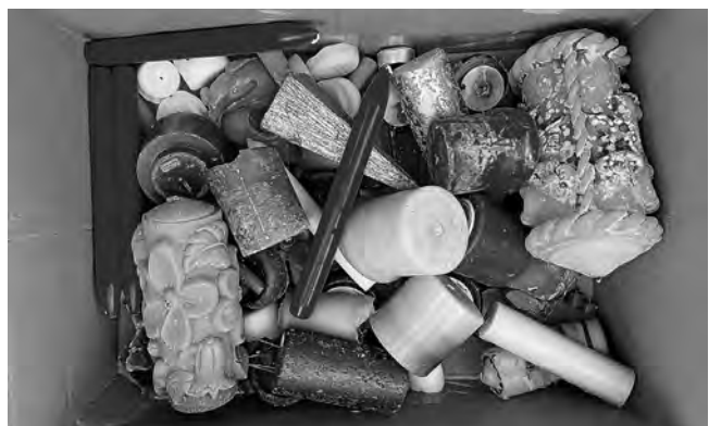
Kerzen und Kerzenreste für die UKRAINE