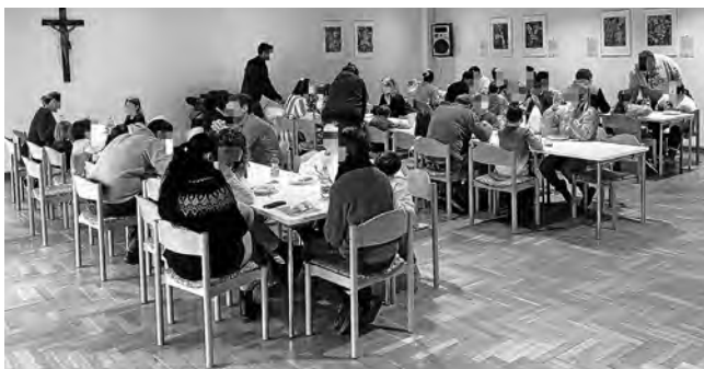
Gemeinsames Mittagessen nach der Kirche Kunterbunt im Gemeindehaus St. Marien