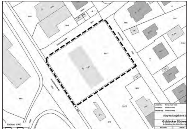
Abgrenzungskarte Foto: Käser Ingenieure GmbH & Co. KG

Für den Planbereich ist die Abgrenzungskarte vom 18.12.2025 maßgebend, die nachstehend dargestellt ist.