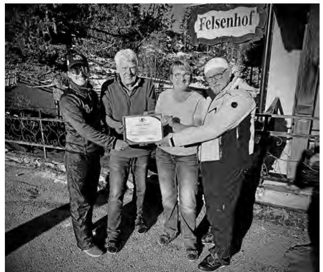
Unser Partner Felsenhof

Unsere letztjährige Dezemberausfahrt war ein voller Erfolg, so das wir uns entschlossen haben, aus unserem Ski-Opening „Berg Glühen“ als feste Veranstaltung im Verein zu etablieren. Egal ob Skifahrer, Rodler, Wanderer oder auch nur Bergliebhaber. Ob Jung oder Alt, es ist für jeden was dabei. Wir freuen uns auf weiter schöne Ausflüge ins schöne St. Leonhard im Pitztal.