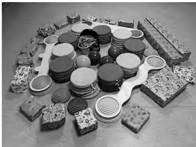
Geschenke für den Kindergarten

Die Weihnachtsfeier war ein rundum gelungenes Erleb- nis, das nicht nur die Kinder, sondern auch uns Erwachsene verzaubert hat.