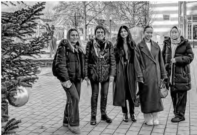
Die neuen Bewohnerinnen der Frauen-WG lernen Plüderhausen kennen

Von den neuen Bewohnern der Familienwohnungen in der AU Adelberger Straße haben wir vor der Weihnachtspause des Gemeindeblatts noch berichtet. Vor Weihnachten bezogen nun auch die ersten Mitglieder der drei Frauen-Wohngemeinschaften ihre neue Unterkunft. Die jungen Frauen kommen aus Afghanistan, dem Irak und der Türkei. Sie freuen sich sehr, dass sie in Plüderhausen mit einem eigenen Zimmer in einer gemeinsamen Wohnung nun auch einen kleinen Privatbereich für sich erhalten haben. Ein solcher Rückzugsbereich ist vor allem für Frauen mit oft schweren traumatischen Erlebnissen sehr hilfreich. Auch diese Menschen haben wir in Plüderhausen herzlich begrüßt, zu den Ämtern begleitet und durch ihren neuen Wohnort geführt.