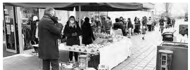
Eröffnung des Ladens am 12.12.2020