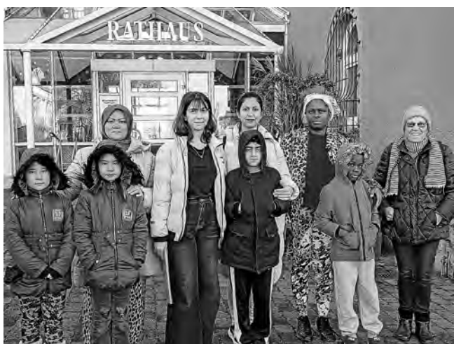
Anmeldung der neuen Plüderhäuser auf dem Rathaus

Vor Kurzem konnten Sie im Gemeindeblatt den Bericht über den Tag der offenen Türe der neuen Anschlussunterbringung Adelberger Straße lesen. Heute berichten wir vom Einzug der ersten Bewohner in diese Unterkunft. Drei alleinerziehende geflüchtete Frauen aus Afghanistan, Nigeria und der Türkei mit jeweils zwei Kindern haben mit großer