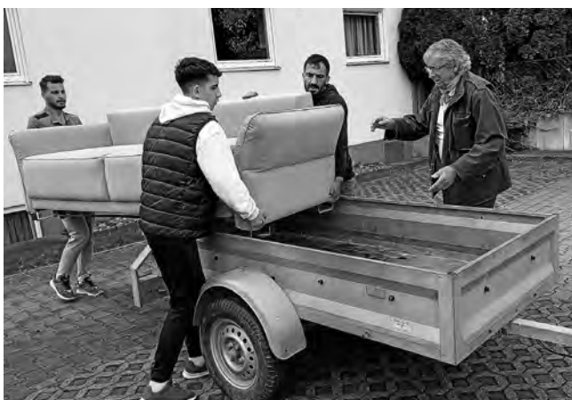
Ein aktueller Sofa-Transport in eine Flüchtlingswohnung

Der AKF bedankt sich herzlich bei den zahlreichen Menschen, die sich bei uns melden und uns die momentan gebrauchten Gegenstände anbieten. Wir bitten aber auch an dieser Stelle nochmal um Verständnis, wenn wir andere Sachen, für die wir gerade keinen Bedarf haben, ablehnen müssen. Diese Angebote sind natürlich auch gut gemeint, aber für deren Annahme fehlt uns einfach der Lagerraum.