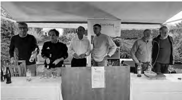
Das Helferteam des Weinstands

Die BürgerStiftung wird den Erlös bei der jährlichen Ausschüttung für gemeinnützige Projekte in der Gemeinde einsetzen.