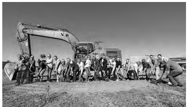
Spatenstich mit allen Beteiligten.