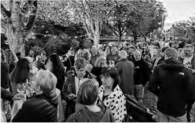
Treff an der Rems