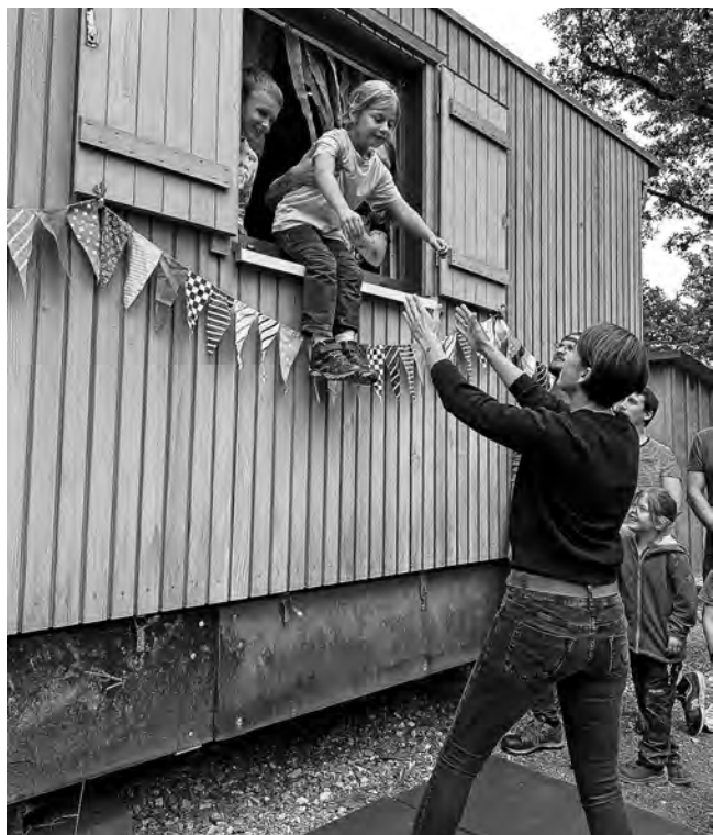
Sprung aus dem Fenster

Und mit dem Satz: „Fenster, Türen aufgerissen, der/die ..wird jetzt rausgeschmissen“, sprangen die einzelnen Kinder aus dem Fenster und wurden draußen von ihren Eltern empfangen.