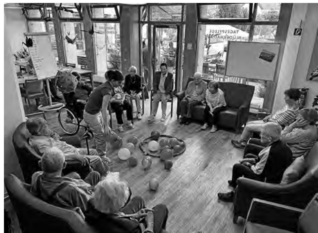
Gemeinsam spielen, singen, grillen - das Sommerfest der Tagespflege Plüderhausen.