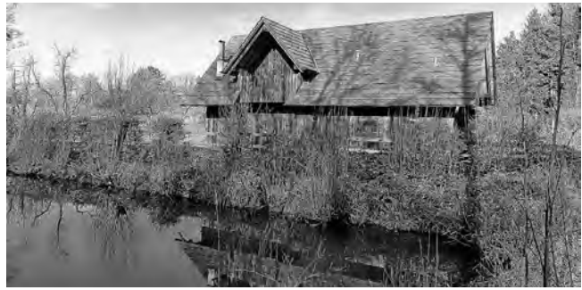
Obstbauhütte am Hummelbach, Mittelpunkt des Vereinslebens soll erweitert werden.

des Gemeinderats behandelt. Interessierte Mitglieder sind herzlich eingeladen. Dominik Ströhlein, Vorsitzender.