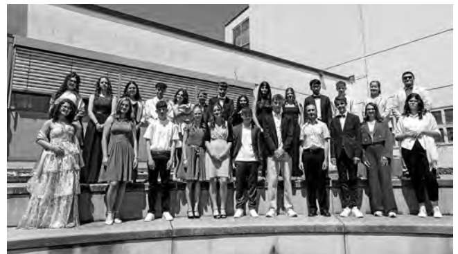
Firmlinge aus Plüderhausen

Ein herzliches „Vergelt's Gott“ allen, die in der Firmvorbereitung und zum Gelingen die feierlichen Gottesdienste in beiden Kirchengemeinden beigetragen haben.