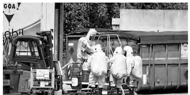
Spezialkräfte der Feuerwehr in Schutzanzügen bannen die Gefahr

Mit entsprechender Spezialausrüstung gelang es den Kräf- ten des Gefahrgutzuges sich bis an die eigentliche Gefah- renstelle vorzuarbeiten. Dort konnten sie die Stoffe identi- fizieren und entsprechende Maßnahmen zur Verhinderung einer weiteren Ausbreitung durchführen.