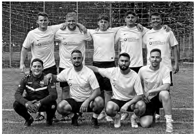
1. Platz beim 26. Hoizerturnier: Jugend forscht

dem runden Leder nachzujagen. Die Spiele begannen um 11 Uhr bei hervorragendem Fußballwetter. Zu fortgeschrittener Stunde, aber immerhin noch bei Tageslicht fand dann das Endspiel statt. Dabei setzte sich das Team von Jugend forscht in einem hochklassigen Finale gegen die Mannschaft voiceforpeace mit 3:0 durch. Im Spiel um Platz 3 behielt der FC Hobby im Neunmeterschießen gegen Miral die Oberhand. Immer wieder konnten die Zuschauerinnen und Zuschauer bei den insgesamt über 60 Partien feine Spielzüge und gepflegtes Passspiel bewundern. Die Hoizer bedanken sich bei allen Mannschaften und Gästen sowie den zahlreichen Sponsoren. Sie alle haben dazu beigetragen, dass das 26. Hoizerturnier in bester Erinnerung bleiben wird. Die Hoizer freuen sich bereits auf die Neuauflage des Turniers im kommenden Jahr.