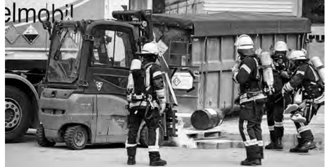
Menschenrettung aus dem Gefahrenbereich

gehandelt werden musste - Gefahr erkennen, Absperren, Menschenrettung durchführen und Spezialkräfte nachfor- dern. Parallel zur weiträumigen Abspernung der Einsatz- stelle wurden sodann parallel die Verletzten im Bereich des Schadstoffmobils unter Atemschutz aus dem Gefahrenbe- reich gebracht und die auf dem Dach befindlichen Personen über eine tragbare Leiter gerettet.