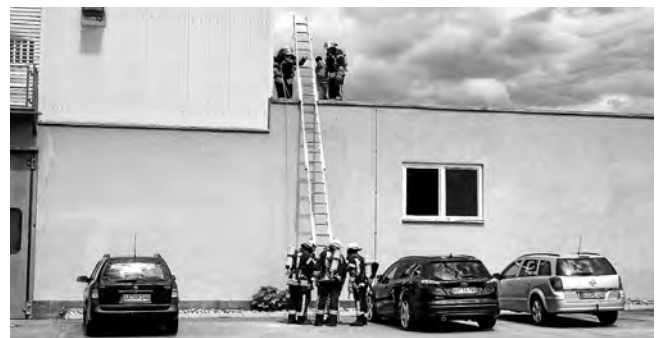
Menschenrettung über tragbare Leitern der Feuerwehr

Wer dachte, dass die Übung nun schon vorbei sei, wurde schnell eines Besseren belehrt - da noch nicht klar war, wel- che Gefahr von den beiden Stoffen und dem gelben Rauch ausging, kamen der inzwischen eingetroffene Gefahrgutzug des Rems-Murr-Kreises, bestehend aus speziell ausgebilde- ten Mitgliedern der Freiwilligen Feuerwehren Winnenden und Backnang sowie der Fachberater Chemie zum Einsatz. Längst waren zu diesem Zeitpunkt auch die Führungsgrup- pe der Freiwilligen Feuerwehr Urbach und zahlreiche Kräfte des Rettungsdienstes Rems-Murr sowie des DRK-Ortsver- bands Plüderhausen vor Ort und kümmerten sich um die Verletzten.