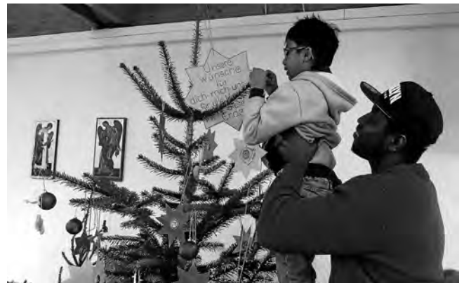
Weihnachtsfeier im katholischen Gemeindehaus

Soll die Bibel damit unsere Gesetzestexte im Ausländerrecht ersetzen und unser Ringen um den richtigen Umgang mit Ausländern und Geflüchteten in unserem Land überflüssig machen? Natürlich nicht. Wer sich aber in unserem politischen Diskurs verpflichtet fühlt, sein christliches Heimatland gegen andersgläubige Geflüchtete verteidigen zu müssen, kann solche klaren biblischen Aussagen nicht ignorieren.