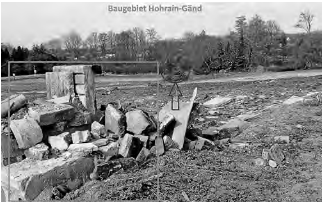
Umsiedlung von Eidechsen Foto: Marcel Heinle. Foto vom 22.03.25

Was würden die Eidechsen an unserer Stelle machen... Würden die Echschen auch so viel Aufwand betreiben um uns aus deren Habitate umzusiedeln? Spaß bei Seite, einerseits ja schön, dass man heute zu Tage das Wissen und die Technik hat, um Kleintiere vor einer Bebauung umsiedeln zu können. Andererseits muss natürlich auch klar sein, dass an so einem Prozess viele Leute mitwirken und es zusätzliches Geld kostet bis die letzte Echse umgesiedelt ist. Am 22.03 wurde dem Gemeinderat bei der Ortsbegehung u.a. erklärt wie sowas in der Praxis von statten geht. An sich spannend: Die Steinhaufen, die der ein oder andere Spaziergänger im Hohrain-Gländ Gebiet evtl. wahrgenommen hat, sind kein echter Müll. Vielmehr sind sie Teil der Strategie zur Umsiedlung von Echschen/Kleintieren. Es werden in den nächsten Wochen noch Zäune und ausgelegte schwarze Folien folgen um die Tiere Stück für Stück Richtung Urbach abzuleiten. Selbst die vielen Reisighaufen sind bewusst so platziert. Aber auch sie sind nur eine Zwischenstation. Damit das ganze auch gelingt, ist nahezu täglich eine Biologin vor Ort und diese wird aus der Ferne durch einen entsprechenden Experten bei der Umsiedlungsmaßnahme begleitet. Am Ende stehen die Kosten, die den Erschließungskosten zugeordnet werden und hoffentlich gesunde Tiere. Das ganze ohne Wertung, sondern lediglich um aufzuzeigen was alles an planerischen und gestalterischen Maßnahmen heut zu Tage beachtet werden muss.