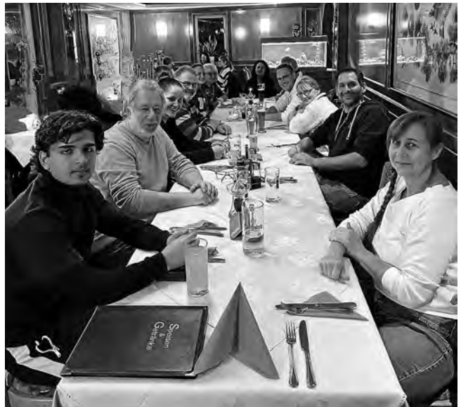
Gesellige Runde im „China Garden“

Wir bedanken uns für einen gemütlichen Abend und den guten Austausch und freuen uns auf den nächsten Stammtisch.