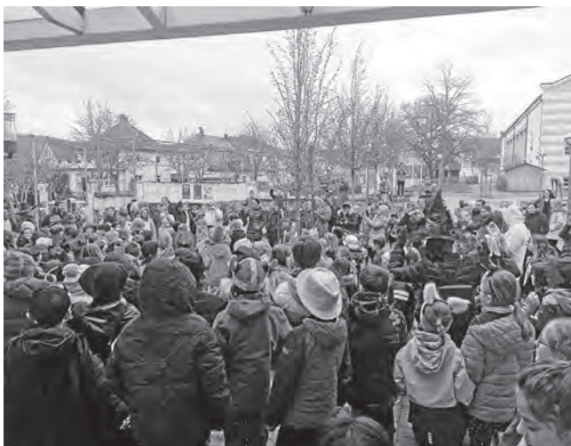
Schülerinnen und Schüler, Lehrkräfte und Eltern der Hohbergschule Plüderhausen vor dem Rathaus

Das Rathaus Plüderhausen bedankt sich für diesen freudigen Besuch!