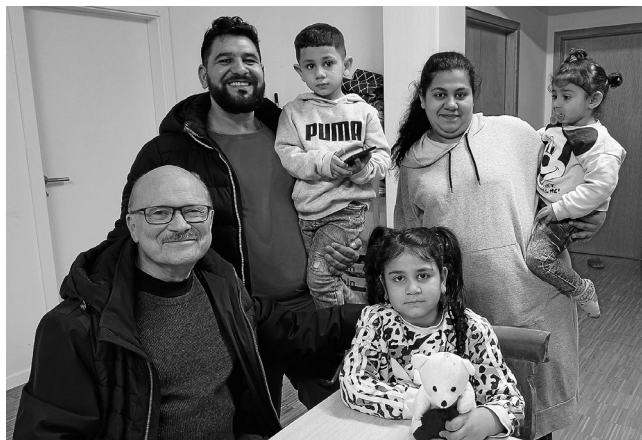
Begrüßung der neuen Familie

Ankunft einen ersten Kontakt mit Ortsbewohnern anbieten. Wir wollen sie in Plüderhausen willkommen heißen und durch eine Ortsführung mit ihrem neuen Wohnort vertraut machen.