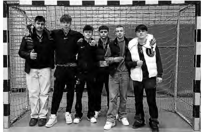
Die Siegermannschaft 2025 - Hohberghallenturnier