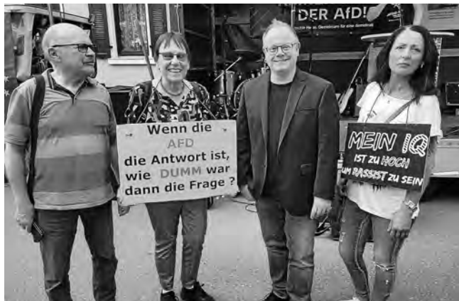
Plüderhäuser AKF-Mitarbeiter mit dem Schorndorfer Oberbürgermeister auf der Demo 2024

Unter diesem Motto hatte das Schorndorfer Bündnis gegen Rassismus und Rechtsextremismus letzte Woche zu einer Demonstration aufgerufen. Die Schorndorfer Nachrichten berichteten, dass gut 700 Menschen diesem Aufruf gefolgt sind. Wie letztes Jahr nahmen auch dieses Mal Bürger aus Plüderhausen und Mitarbeiter des AKF an dieser Kundgebung teil.