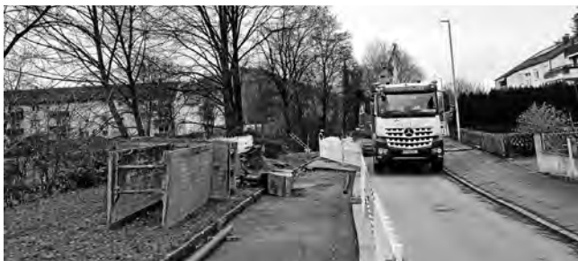
Der Wasserleitungsbau in der Remsstraße schreitet gut voran

Die kommunalpolitischen Beschlüsse haben dazu geführt, dass im vergangenen Jahr die Trendwende herbeigeführt werden konnte. Erstmals seit Jahrzehnten wurde die erforderliche Netzerneuerungsrate erreicht. Hierzu ist in Plüderhausen der Austausch von Wasserleitungen auf einer Länge von ca. 780 Metern erforderlich. Dies bedeutet, dass sich der Zustand des Wassernetzes erstmals seit sehr langer Zeit nicht weiter verschlechtert hat. Im Gegenteil, mit dem Austausch von Wasserleitungen auf einer Gesamtlänge von gut einem Kilometer konnte ein klein wenig des insgesamt sehr gewaltigen Investitionsrückstaus aufgeholt werden.