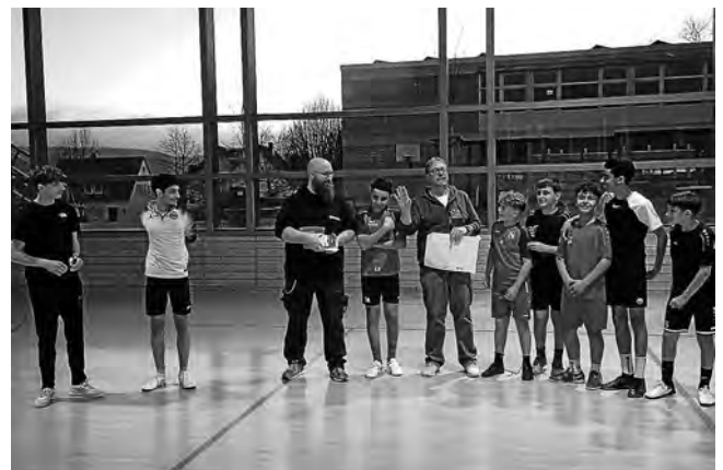
Die Sieger beim Atriumturnier