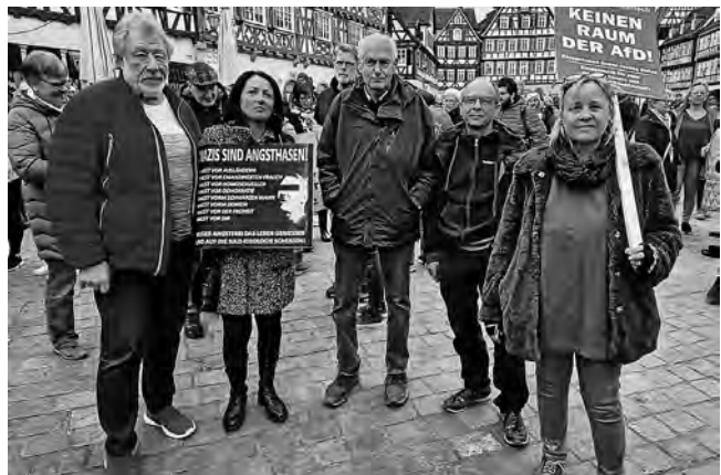
Und auch 2025 sind wir mit dabei