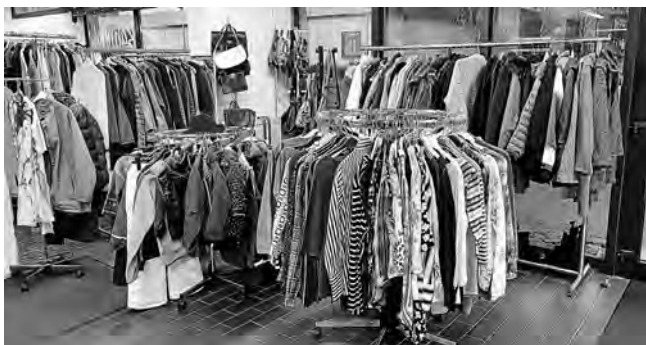
Ein Ausschnitt der vollen Kleiderstände