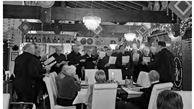
Der Männerchor hielt ein Ständle für die Geehrten

Wir bedanken uns bei allen Geehrten sehr herzlich für ihr Engagement! Es ist der Grundstein unserer Vereinsarbeit und wir können uns glücklich schätzen, solch engagierte Vereinsmitglieder zu haben.