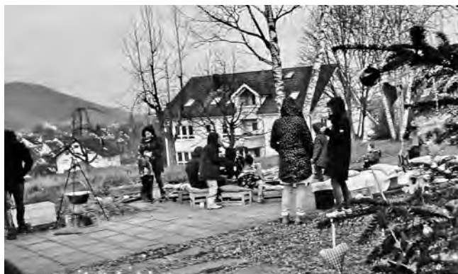
Gemütlicher Jahresabschluss mit Stockbrot am Lagerfeuer

Nein, die Spende reichte auch noch um jedes unserer ca. 140 Kinder mit einem kleinen Wichtelgeschenk zu überraschen.