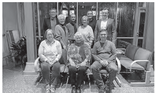
Neuer Vorstand der Hilde und Hermann Walter-Stiftung Plüderhausen