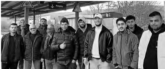
Start zur gemeinsamen Fahrt nach Schorndorf

Kurz vor Weihnachten wurde unserem Ort noch eine größere Gruppe von Geflüchteten zugewiesen. Die meisten von ihnen kommen aus Syrien, einzelne auch aus Irak, Iran, Marokko und Tunesien. Die 16 - überwiegend jüngeren - Männer wurden in der GU Birkenallee untergebracht. Bei der Aufnahme der neuen Bewohner wurde die diensthabende Sozialarbeiterin von zwei Schorndorfer Kolleginnen unterstützt. Und auch der Vertreter des AKF war vor Ort und begleitete die neuen Plüderhäuser in den ersten drei Tagen an ihrem neuen Wohnort.