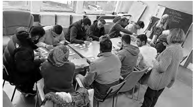
Ein Blick in den AKF-Raum beim Unterricht Wir heißen die neuen Birkenallee-Bewohner in Plüderhausen herzlich willkommen und wünschen ihnen einen guten Start an ihrem neuen Wohnort und ins neue Jahr.

Hier wollen sie nun gerne für eine Weile leben. Damit ihnen aber auch die Integration in diesen schönen Ort gelingt, möchten alle so schnell wie möglich die deutsche Sprache erlernen. Der Aufnahme in einen offiziellen Sprachkurs geht aber meist eine längere Wartezeit voraus. Deshalb freuten sich alle sehr über das Lernangebot der AKF-Sprachhilfe, das diese Wartezeit überbrücken kann. Unseren Ortsrundgang beendeten wir deshalb mit einem Abschlussgespräch im AKF-Unterrichtsraum in der Schulstraße. Dort fühlten sich alle sofort richtig wohl, dass sie am liebsten gleich zum Unterricht dortgeblieben wären.