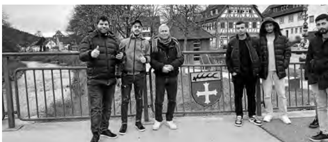
Alle finden Plüderhausen wunderschön

Am Ankunftstag ging es natürlich zuerst um den Einzug in die Unterkunft und vor allem die Einrichtung der Schlafplätze. Sehr wichtig war dann am zweiten Tag die gemeinsame Fahrt nach Schorndorf. Nur bei der dortigen Kreissparkasse konnten die jungen Männer ihren Scheck mit den Unterhaltsleistungen einlösen. Damit konnten sie sich dann endlich etwas zum Essen einkaufen. Wo man das machen kann, zeigten wir ihnen bei der anschließenden Ortsführung durch Plüderhausen. Weitere wichtige und schöne Stellen dort konnten sie dann am dritten Tag kennenlernen. Dabei war zu spüren und zu hören, wie begeistert alle von ihrem neuen Wohnort waren.