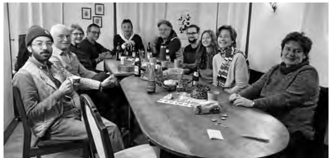
Bei unserer Weihnachtsfeier mit Punsch und Fruchtebrot

Die Petition wird von der Polizeigewerkschaft, sowie etlichen Tier- und Umweltschutzorganisationen unterstützt. Zusammen für eine lebenswerte Zukunft!