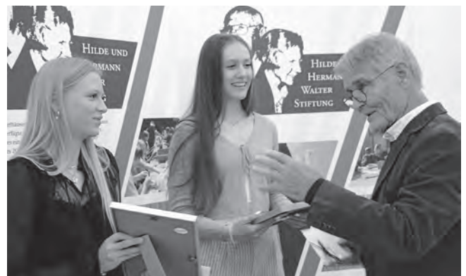
Dr. Häußermann bei der Preisverleihung AUSGEZEICHNET

Informationen zur HHWS finden Sie auf der Homepage: https://www.pluederhausen.de/hhws/