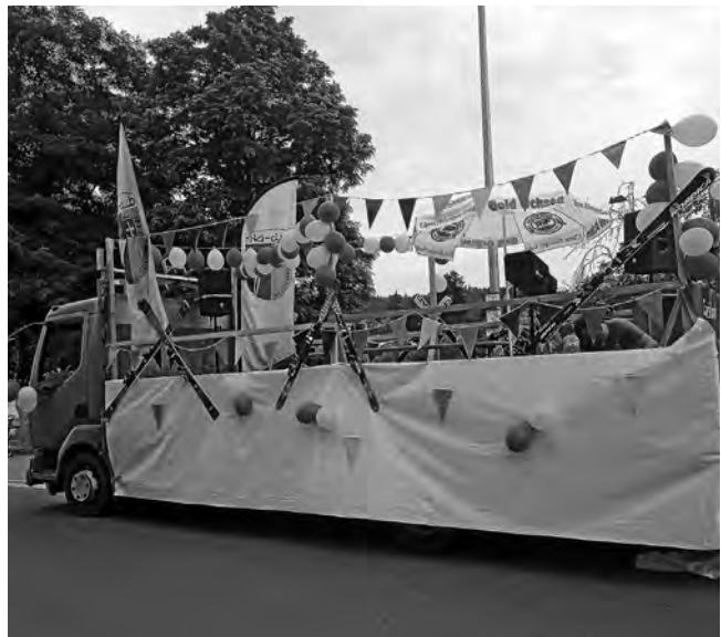
Fest Umzug LKW

Ein besonderer Dank an die Firma Holzbau Bogunovic, für das Sponsoring der Hölzer wie auch an die Firma Holzbau Konrad aus Unterweissach für die Bereitstellung des LKW´s.