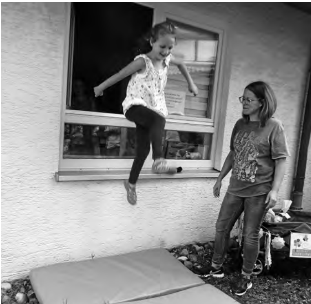
„Fenstersprung“ - Schule, wir kommen!!!