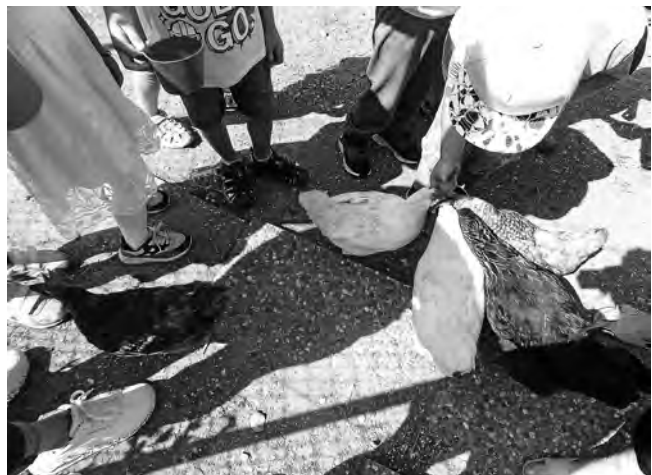
Wir füttern die Hühner in der Grundschulbetreuung

Im Anschluss erwartete die Kinder das Mensa-Team mit einem leckeren Mittagessen und einem Nachtsch - hier gab es ausreichend Zeit für erste Schulgespräche. Frau Schuler holte die Kinder nach dem Mittagessen für eine Besichtigung des Grundschulgebäudes ab, wo sie einen ersten Einblick bekommen konnten, was die Großen nach den Sommerferien erwartet.