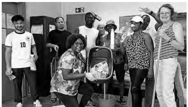
Auch der Unterrichtsraum wurde vom Putz-Team gründlich aufgeräumt und auf Hochglanz gebracht