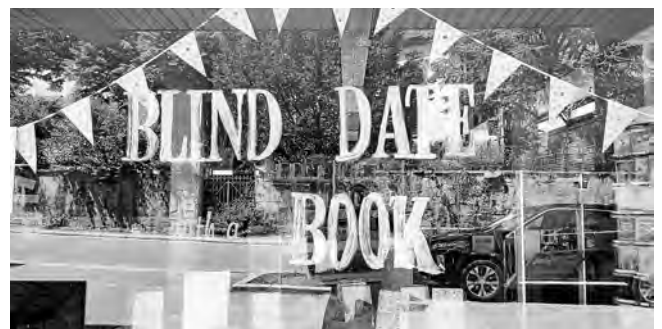
Blind Date with a book

Zeitgleich zu Heiss auf Lesen warten wieder spannende Blind Dates auf unsere Leser*innen. Ein Blind Date: Der Reiz des Unbekannten, prickelnde Neugier und ein wenig Nervenkitzel. Klingt doch super, oder? Daher wollen wir zu einem „Blind Date mit einem Buch“ bitten! Welche Bücher warten, bleibt wie bei einem echten Blind Date erst einmal geheim. Denn hierbei zählen die inneren Werte! Daher verbergen wir das Äußere und geben nur einen Hinweis zum Genre des jeweiligen Buches. Chance auf die Buch-Liebe nicht entgehen lassen! Seit 15. Juli warten in der Gemeindebücherei die „Blind Dates“.