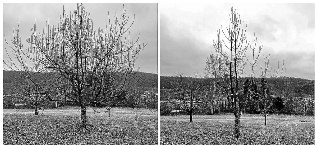
Hochstammapfelbaum vor und nach dem „Aktivierungschnitt“.