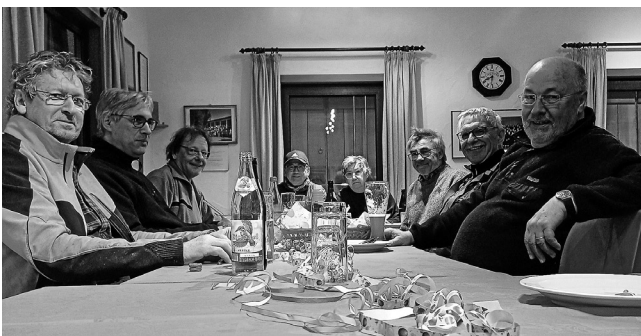
Die fleißigen Arbeiter nach getaner Arbeit