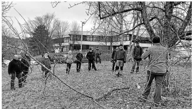
„Nicht an den Bäumen rumschnipfeln, sondern mit wenigen Schnitten viel erreichen“