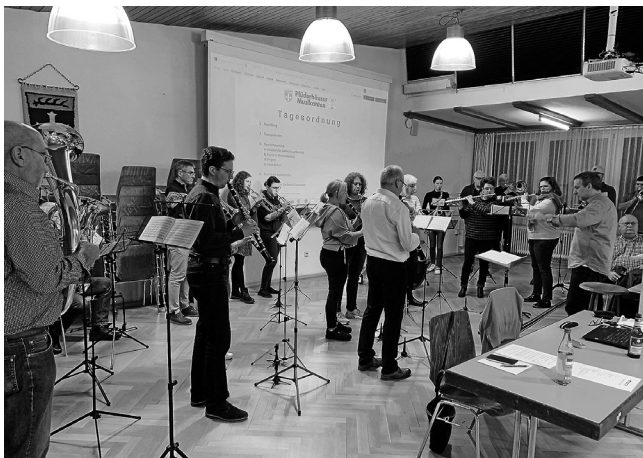
Aktive Kapelle eröffnet die HV mit einem Musikstück