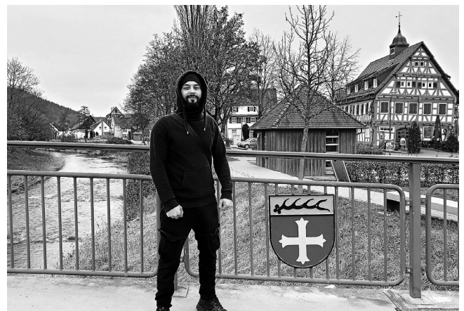
Die schönen Plätze an der Rems gefallen dem jungen Vater ganz besonders.

Auch aus Tunesien fliehen in letzter Zeit immer mehr Menschen, weil sie dort keine Perspektive mehr sehen. Wirtschaftskrise und Perspektivlosigkeit, politische Dauerkrisen und Arbeit höchstens zu schlechten Bedingungen sorgen dafür, dass immer mehr, vor allem junge, teilweise gut ausgebildete Leute in den letzten Jahren ihrer Heimat den Rücken gekehrt haben und den Weg nach Europa suchten. Beobachter berichten, dass Tunesien inzwischen zwar den Übergang in die Demokratie abgeschlossen hat, die Wirtschaft jedoch nicht richtig in Gang kommt. Die Regierung will nun gegen Korruption und die postrevolutionäre Mafia entschlossener vorgehen. Dies gelingt jedoch nur teilweise. Die neue tunesische Familie in Plüderhausen zum Beispiel wurde vom Terror der Mafia in die Flucht getrieben. Der Vater zeigte uns Fotos von ihrem lichterloh brennenden Haus, in das sie nicht mehr zurückkehren konnten.