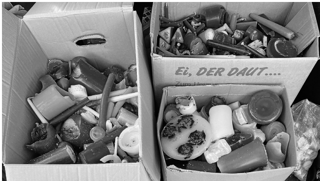
3 volle Kartons schon am letzten Freitag