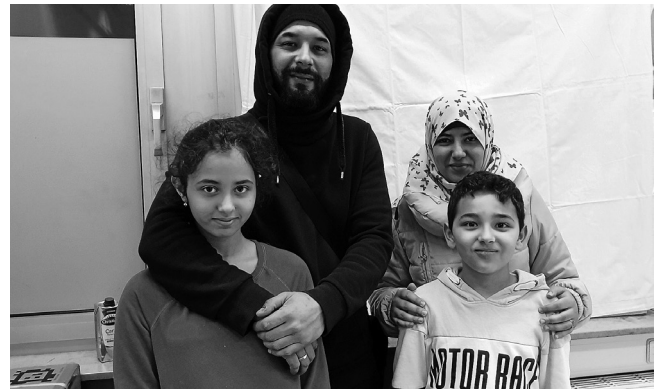
Die neuen Bewohner der Birkenallee

In der vergangenen Woche konnte der AKF eine sehr nette Familie aus Tunesien in Plüderhausen begrüßen und ihnen ihren neuen Wohnort zeigen.