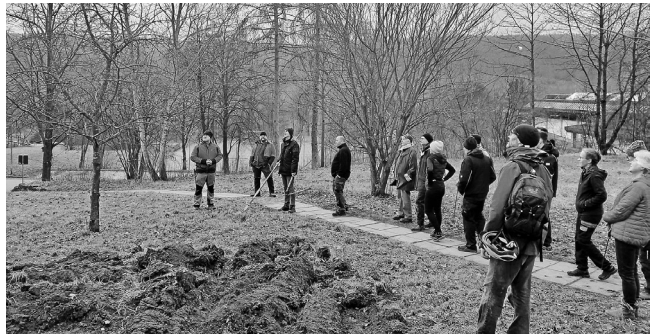
„Ansprachen des Baumes vor dem Schnitt ist wichtig.“